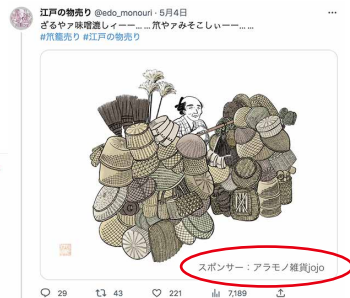
スポンサー名入れ