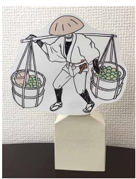
動くディスプレイ